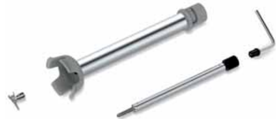
Coltelli smontabili Removable knives