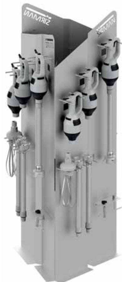
Struttura autoportante con 3 espositori inox Self-supporting structure with 3 display stands