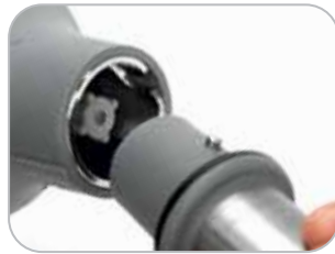
Aggancio rapido utensili Quick tool assembly