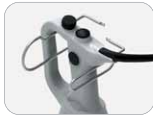
Supporto a filo opzionale Optional wall mount