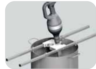
Supporto pentola opzionale Optional bowl support