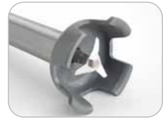
Campana e coltelli inox Bell and knives of stainless steel