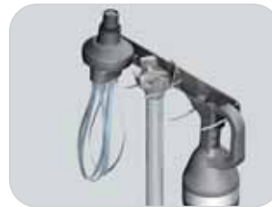
Supporto a muro opzionale Optional wall support