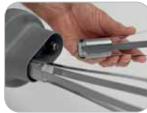
Sgancio frusta Whisk release