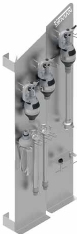
Espositore inox opzionale Optional display stand