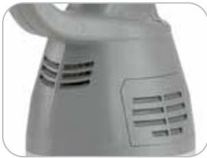
Griglie di ventilazione IP x3 Air intake IP x3